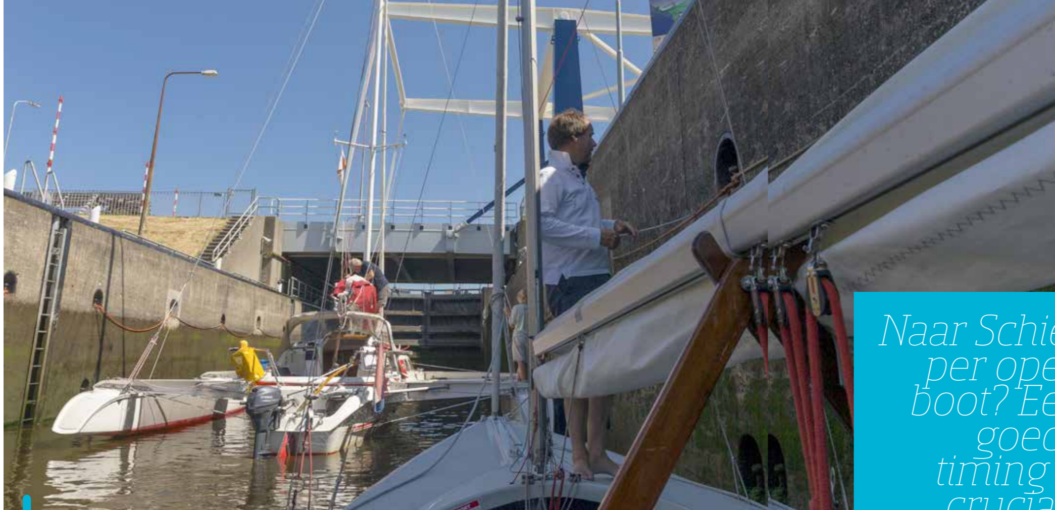
In de sluis van Lauwersoog kunnen we vast oefenen met hoog- en laagwater.