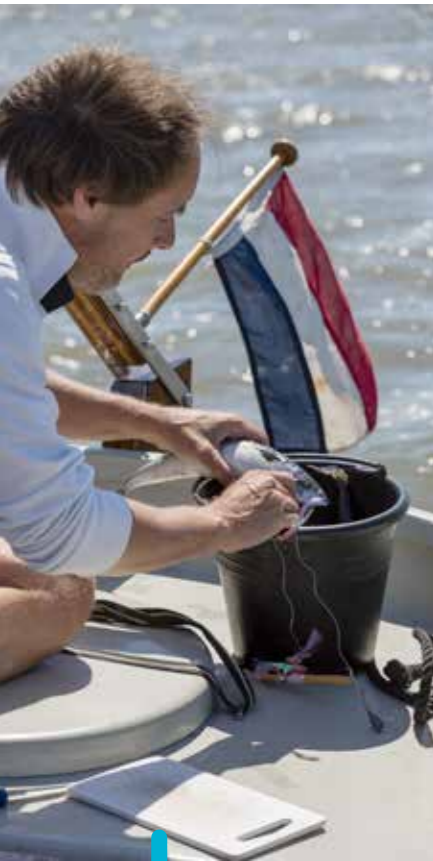
Gauw die makrelen schoonmaken, we krijgen al trek.

Eigenlijk is de sprong van Lauwersoog naar Schiermonnikoog een kippenindje, ideaal voor een minibreak én geschikt voor iedereen die graag de overkant wil zien. Hoog en droog op Brakzand hebben we prima zicht op Lauwers- en Schiermonnikoog. Viskotters, jachten en de veerboot, allemaal maken ze omtrekkende bewegingen, óm het wantij heen, met ons als middelpunt van dat alles. Ook al staan we op de Waddenzeebodem, toch zijn we voor enkele uren even los van de rest van de wereld. Soms wil je dat.