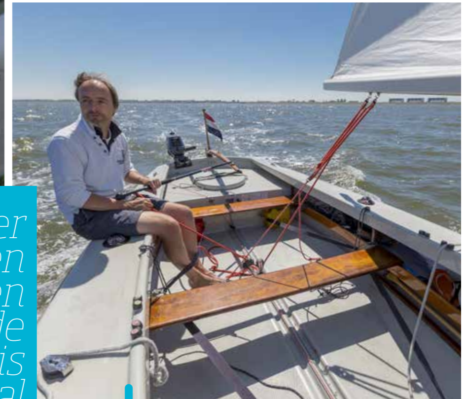
Zon en wind op de Zoutkamperlaag. Veel mooier wordt het niet.

Naar Schier per open boot? Een goede timing is cruciaal