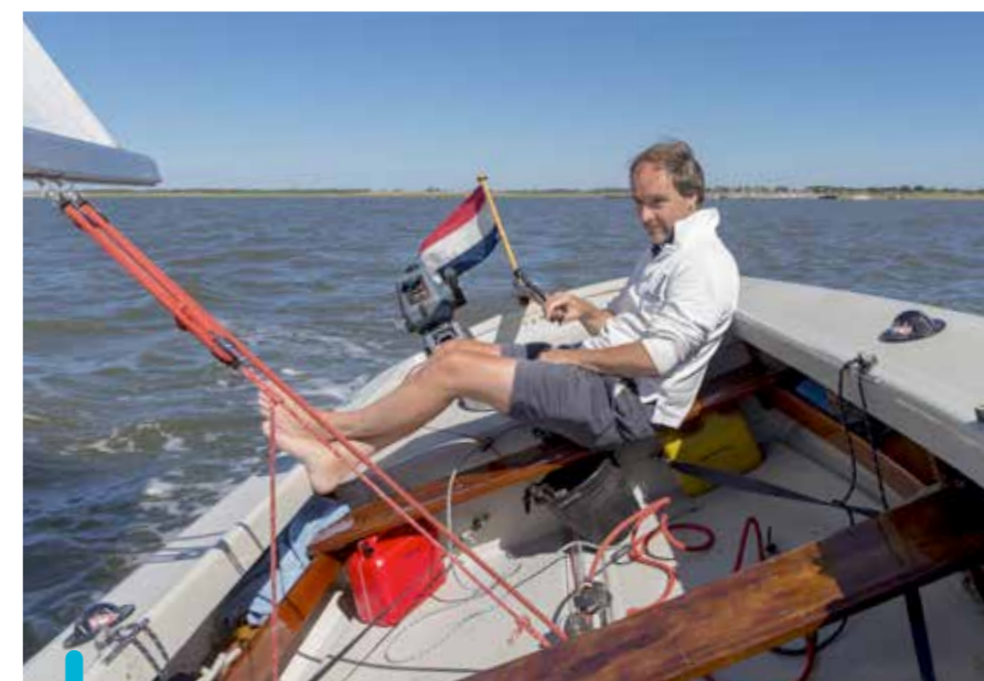
Time is up. Na een aangename avond in hotel Van der Werff moeten we weer naar huis.