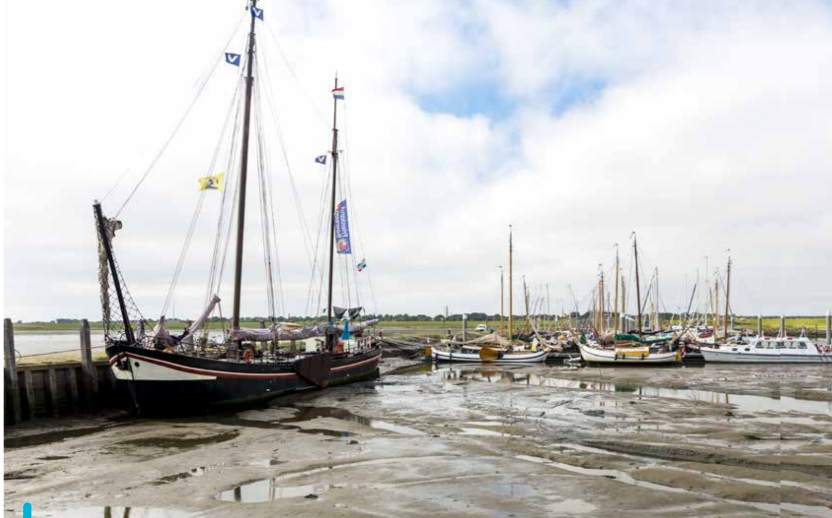
Voorin valt de haven droog, achterin blijven we drijven.

In de schemer lonkt dat andere culinaire baken: Van der Werff