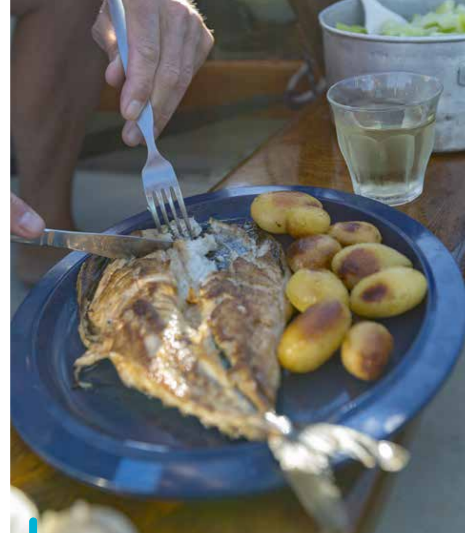
Ons eigen eenvoudige visrestaurant midden op het Wad.

De zeilen kunnen eraf en langs boeien en prikken zigzaggen we richting het eiland. Hoe gestaag en ingetogen ook, de vloed is nog niet klaar met z'n werk. Diverse schepen staan droog naast de geul en met enige verbazing wordt de uit de nevel komende Wiedeweerga opgemerkt. Zodra we op de motor tussen de havenhoofden van de jachthaven naar binnen pruttelen zien we de havenmeester al klaarstaan. Met een brede grijns heet hij ons welkom, wijst een plek en zodra we de box invaren stopt de buitenboordmotor vanzelf. De zeenevel verdwijnt en de volle maan komt tevoorschijn boven het oostwad. We tuigen de boot af en de kuipent op. Nog een half uurtje laven we ons aan de whisky en de positieve opmerkingen van andere haven-gasten ("Ver vóór hoogwater al de haven in? Vanuit de schemering? Een open boot?") en dan is de dag toch echt voorbij. De zoute voeten mogen in de warme slaapzak.